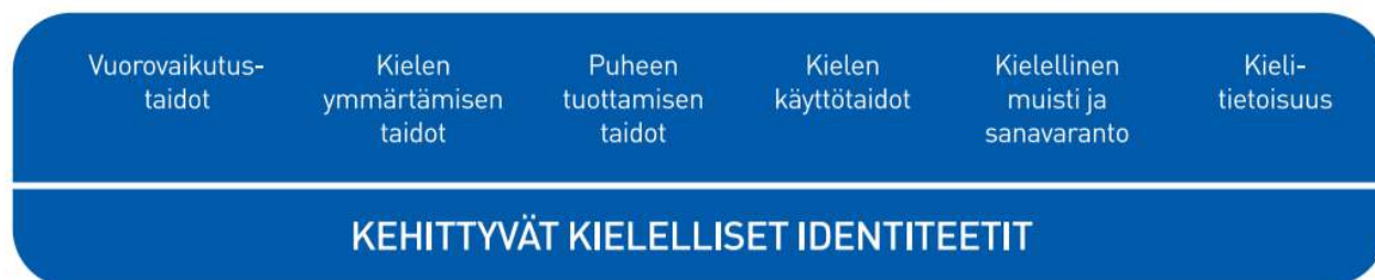
Kuvio 2. Lasten kielen kehityksen keskeiset osa-alueet varhaiskasvatuksessa

Kielen oppimisen kannalta on tärkeää tiedostaa, että saman ikäiset lapset voivat olla eri vaiheissa kielen kehityksen eri osa-alueilla. Kielelliset identiteetit kehittyvät , kun lapsia ohjataan ja tuetaan kielellisten taitojen ja valmiuksien keskeisillä osa-alueilla.